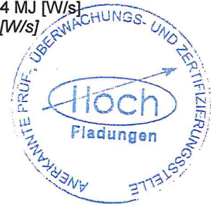
Tabelle / table 1: Prüfergebnisse der SBI Prüfungen / test results of the SBI tests

FDP: brennendes Abtropfen [s] flaming droplets / particles [s]